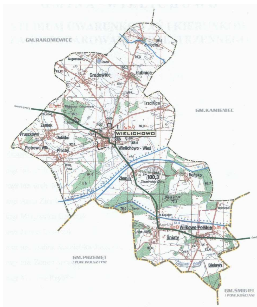
Rysunek 1. Mapa gminy Wielichowo

Miejscowość Wielichowo-Wieś jest jedną z 15 wsi sołectkich gminy Wielichowo. Położona jest w zachodniej części województwa wielkopolskiego w gminie Wielichowo, w powiecie grodziskim. Cała gmina zajmuje obszar 10 758 ha, natomiast sama miejscowość Wielichowo-Wieś rozpościera się na obszarze ok. 1 453 ha. Część miejscowości objęta jest obszarem NATURA 2000. Specyfiką tej miejscowości, jak obrazuje Rysunek 2 jest to, że tworzą ją tereny otaczające miasto Wielichowo, nie jest to zatem wieś skoncentrowana lecz charakteryzuje się znacznym rozproszeniem w terenie.