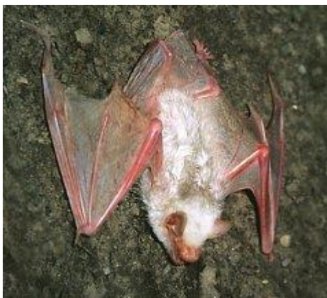
Fot. 4. Zdjęcie albinotycznego mrocza.

rozpoczęto działania. W efekcie końcowym stolarz z Wielichowa, pan Jerzy Gracz zamontował platformę z włazem do wchodzenia na górną kondygnację, a firma Tel-Poż-System "ISKRA" z Poznania, dokonała impregnacji drewnianej konstrukcji nietoksycznym środkiem ogniochronnym. Cała górna kondygnacja strychu wykładana jest folią w celu ułatwienia sprzątania.