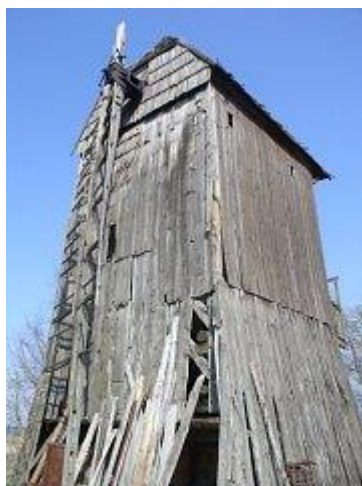
Fot. 6 Śniaty – zabytkowy wiatrak z 1764 r.