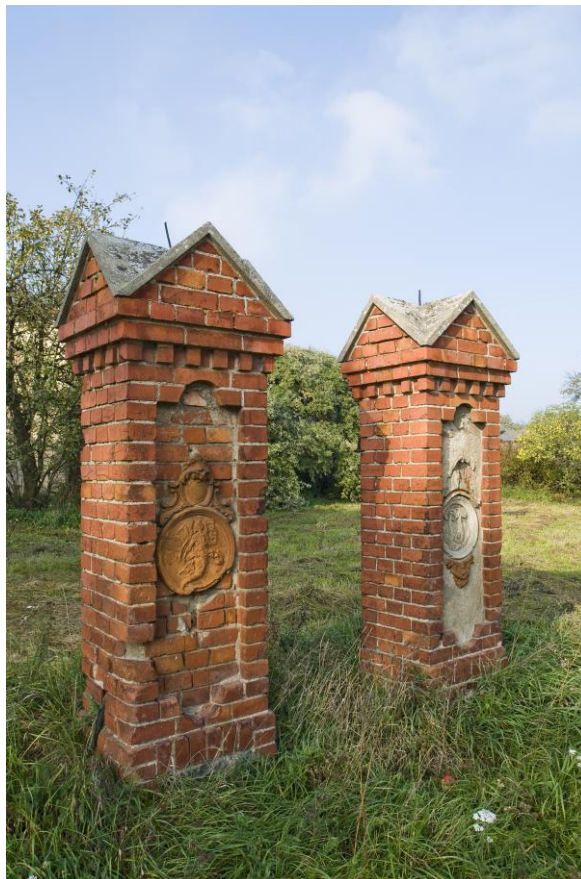
Fot.2 Brama na dziedziniec dawnej gospody, przed 1914 r.