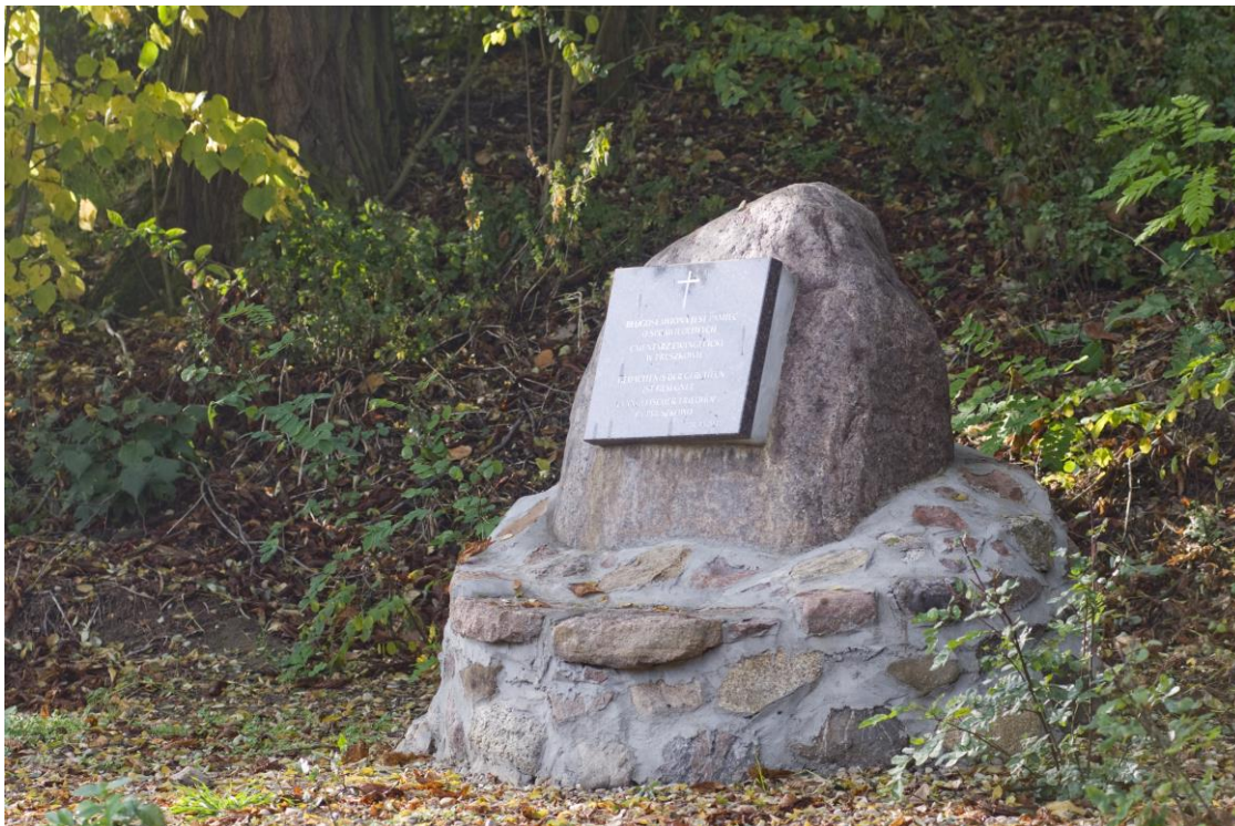
Fot.1 Cmentarz ewangelicki w Pruszkowie

W Pruszkowie zlokalizowany jest także cmentarz ewangelicki.