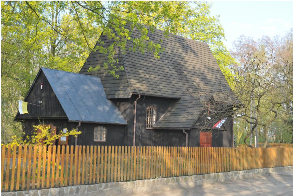
Fot. 2 . Kościół p.w. Św. Klemensa w Ziełęczynie