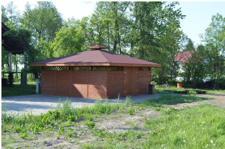
Fot . 1 Altana letnia, miejsce spotkań mieszkańców

We wsi aktywnie działa Rada Sołectka. Funkcjonuje też Koło Gospodyń Wiejskich. Organizacje te współdziałają ze sobą przy realizacji wspólnych przedsięwzięć służących mieszkańcom wsi. Do stałych wydarzeń organizowanych we wsi należą: dożynki wiejskie, dzień dziecka oraz dzień kobiet.