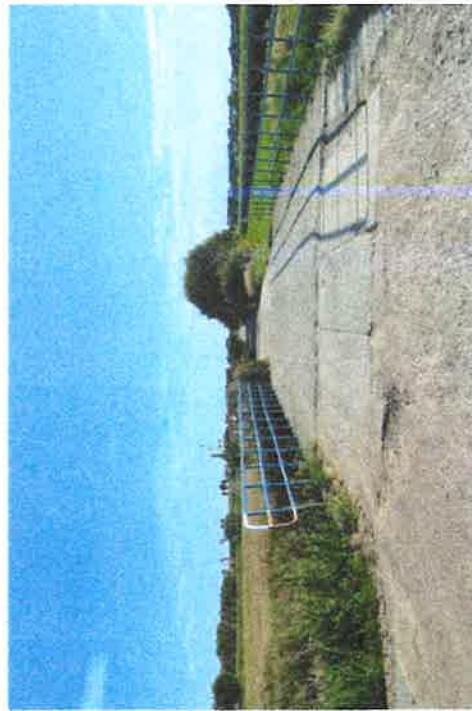
Droga do Helenopola