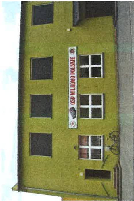
świątlica wiejska, remiza, biblioteka