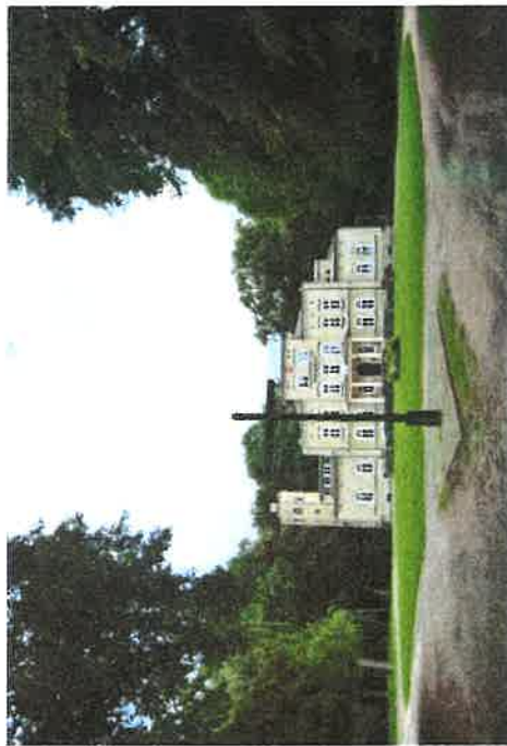
Zespół pałacowo - parkowy