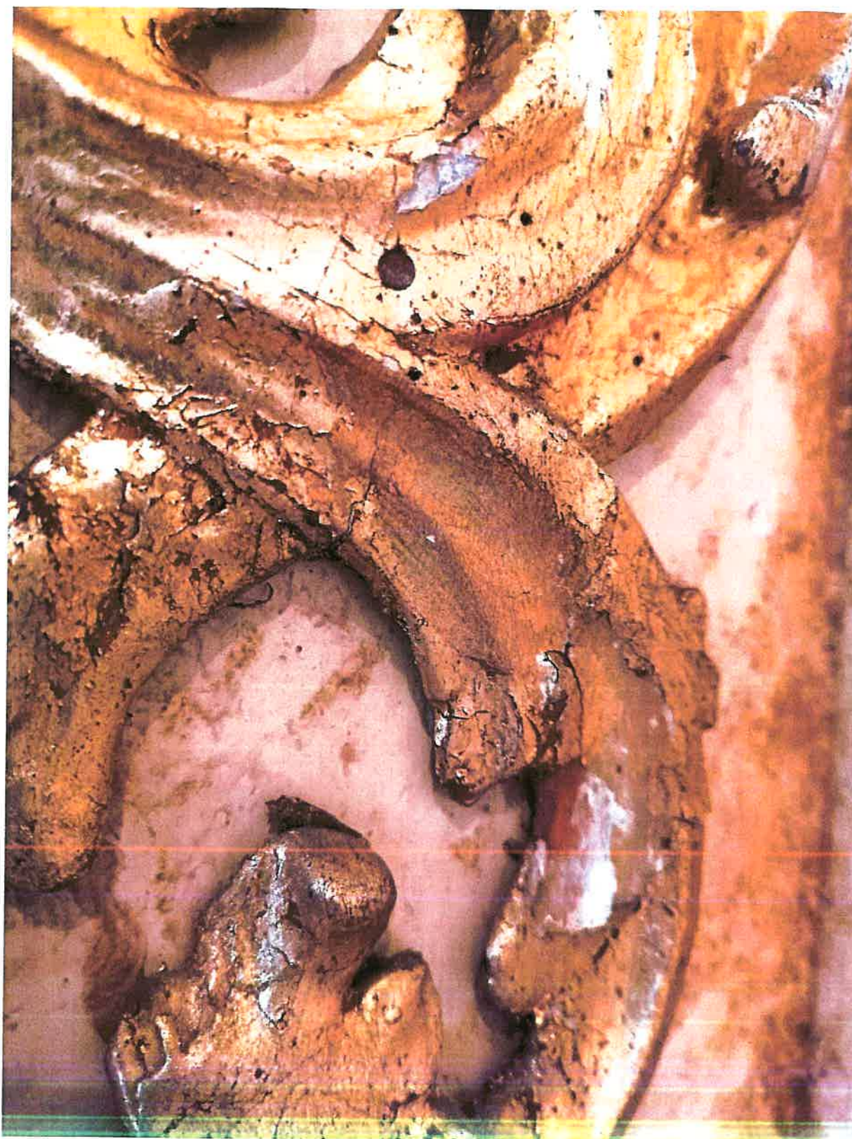
Odpadające grunty z powierzchni złoconej